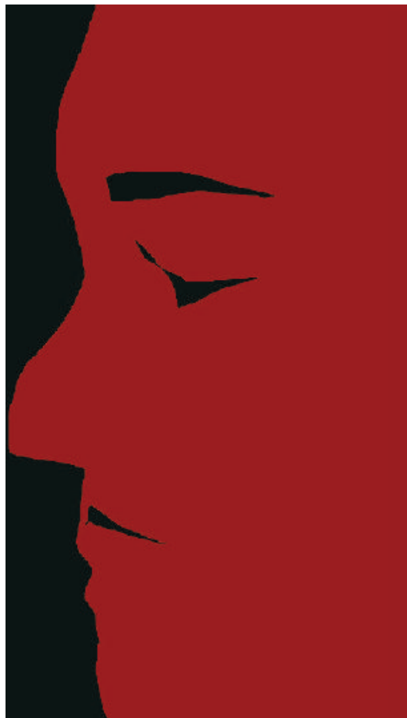
Igor Tuveri, in arte Igort, qui in un suo autoritratto disegnato per Tuttolibri

«E' molto difficile scegliere per chi, come me, vive notte e giorno in mezzo ai racconti, di qualunque natura essi sia-